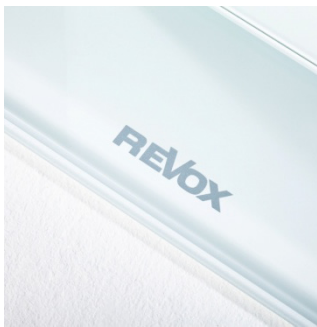
Logo auf weißem Glasfuß

Vier langhubige Bass-Treiber, ein verzerrungsarmer Mitteltonlautsprecher und ein Hochtöner mit großer Gewebemembrane sorgen für das ungemein exakte und kraftvolle Klangbild der Prestige G140. Die elegante Klangsäule liefert als Stereolautsprecher ebenso wie in Surround-Konfigurationen exzellente Klangergebnisse.