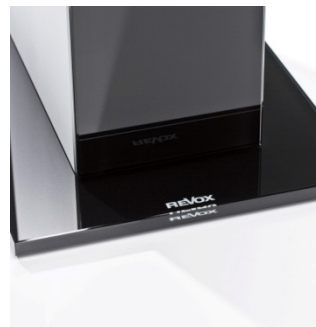
Logo auf schwarzem Glasfuß