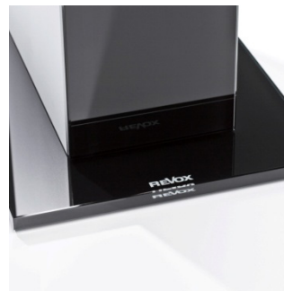
Logo auf schwarzem Glasfuß