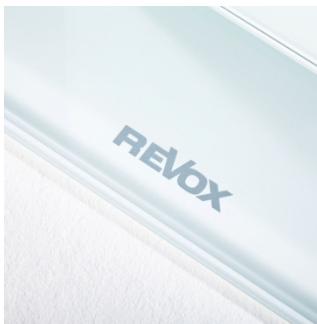
Logo auf weißem Glasfuß

Vier langhubige Bass-Treiber, ein verzerrungsarmer Mitteltonlautsprecher und ein Hochtöner mit großer Gewebemembrane sorgen für das ungemein exakte und kraftvolle Klangbild der Prestige G140. Die elegante Klangsäule liefert als Stereolautsprecher ebenso wie in Surround-Konfigurationen exzellente Klangergebnisse.